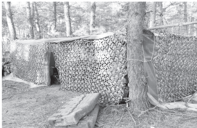
Маскировка по назначению.