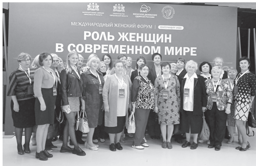
Делегация городского округа Верх-Нейвинский.

рьерную росту. Реализуем комплексные программы государственной поддержки